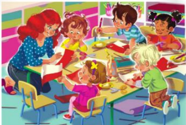
Jak Olek świętował Dzień Flagi Rzeczypospolitej Polskiej?