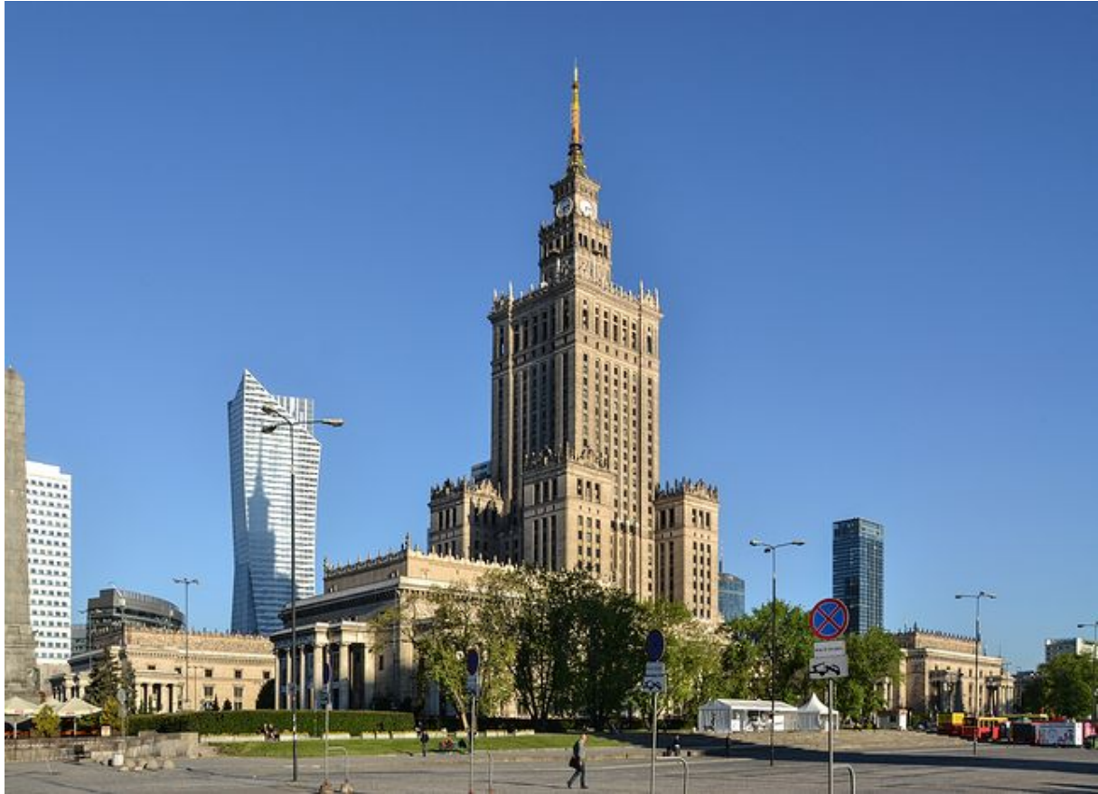
PAŁAC KULTURY I NAUKI