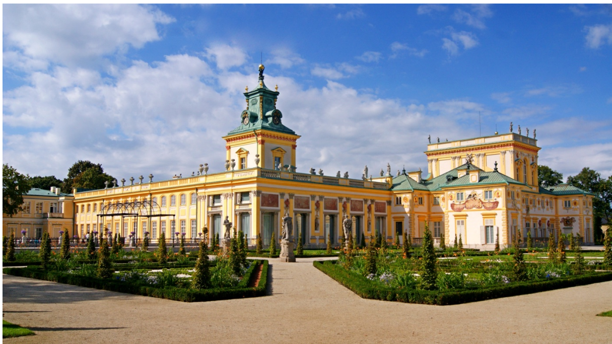
PAŁAC W WILANOWIE