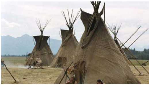
Tradycyjne domy indiańskie – „wigwam” / „tipi”