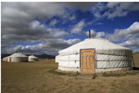
„jurta” – mongolski dom na stepie w Azji