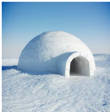
„igloo” – dom Eskimosów